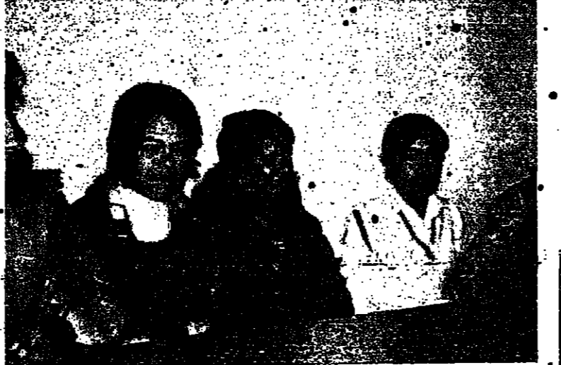
نشاطات الحلقة الاجتماعية

في الأسابيع الأخيرة حصلت فتيات طبره على شهادة تقدير خاصة . فقد بلغت صادرات احدنا خياطة «التابع لشركة بوليسريج» الذي يعمل في القرية أكثر من مليوني دولار . وجدير بالذكر أن إنتاج هذا الصنع يقف رواجا كبيرا في دول السوق الأوروبية !